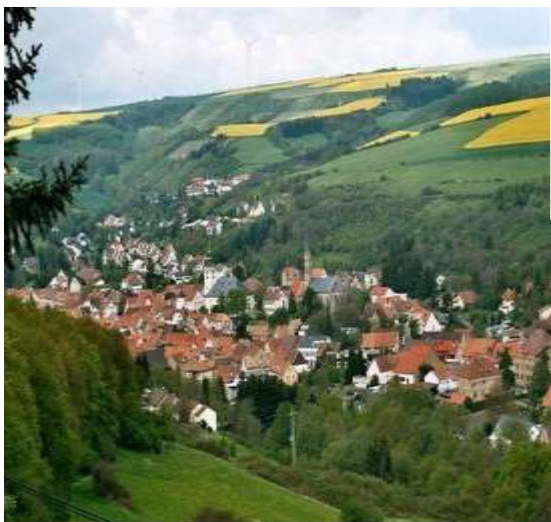
Talblick von unserem Burg-Hotel